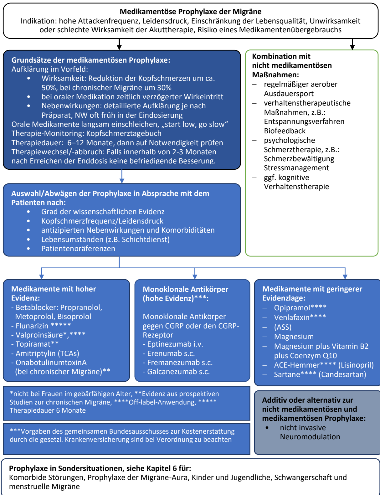
Abbildung 2. Medikamentöse Prophylaxe der Migräne